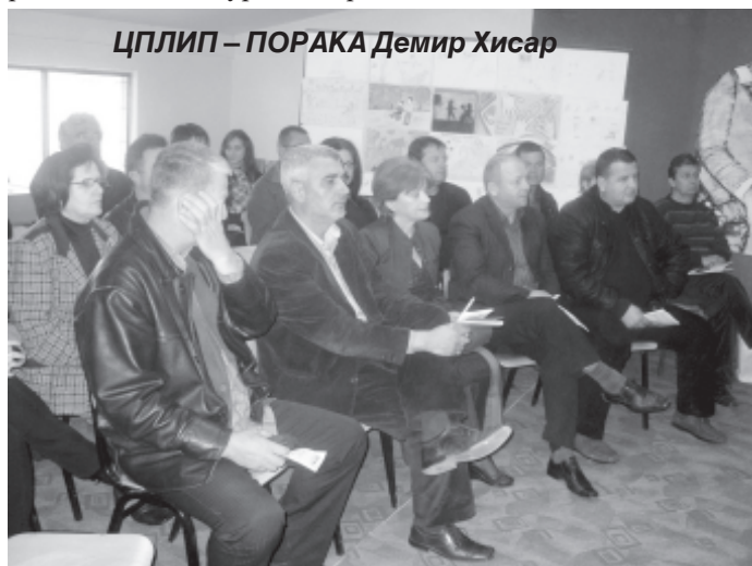
ЦПЛИП – ПОРАКА Демир Хисар

со еколошкото друштво Планетум. Потоа беа во посета на детската градинка “Мајски цвет” каде поставија куќички за птици изработени од членовите на ЦПЛИП – ПОРАКА Струмица. На 2-ри декември се организираше средба помеѓу градоначалникот на Општина Струмица и претставници на невладини организации, на која тој повторно ја истакна подготвеноста на општината за соработка со граѓанските организации.