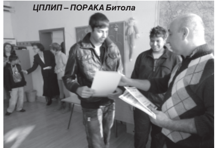
ЦПЛИП – ПОРАКА Битола