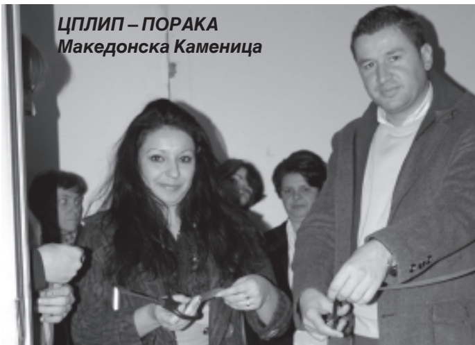
ЦПЛИП – ПОРАКА Македонска Каменица

ЦПЛИП – ПОРАКА Скопје, во рамките на програмата за одбележување на 3-ти Декември реализираше различни активности. На 5-ти декември се одржа Отворен ден на дневниот центар ПОРАКА Скопје на кој присуствуваа голем дел од соработниците и поддржувачите на дневниот центар. Во рамките на Отворениот ден, РЦПЛИП – ПОРАКА и ЦПЛИП – ПОРАКА Скопје доделија благодарници на институции и поединци како израз на благодарност за поддршката во нивната работа. Во периодот од 28-ми ноември до 9-ти декември во просториите на Општина Аеродром беше поставена изложба од корисниците на дневниот центар. Се реализираа работилници и часови со предавања на тема “Што е интелектуална попреченост?” со учениците од ОУ “Љубен Лапе” и ОУ “Браќа Миладиновци”. На 1-ви декември беа спроведени заеднички активности со Црвен Крст на Град Скопје во облик на музичка работилница и посета на спасителната станица на планината Водно. Се организираше и изложба со изработки од корисниците на дневниот центар ПОРАКА Скопје и заедничка работилница со студенти од Факултетот за уметност што се спроведе на 7-ми декември.