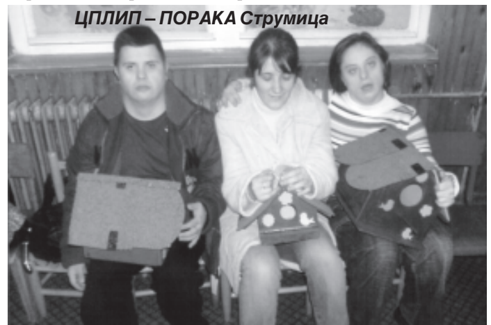
ЦПЛИП – ПОРАКА Струмица

ЦПЛИП – ПОРАКА Струмица одбележувањето на 3 Декември го започна со акција за чистење на дел од Градскиот парк која ја спроведоа на 1-ви декември заедно