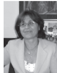
Невенка Крушаровска Заменик Народен правобранител