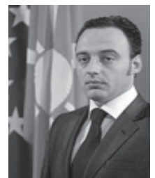
Спиро Ристовски Министер за труд и социјална политика

Бидејќи целта на Конвенцијата е да промовира, штити и да осигура целосно и еднакво уживање на сите човекови права наш предизвик како држава треба да биде гарантирањето на рамноправноста и недискриминацијата на лицата со попреченост кои што живеат заедно со нас.