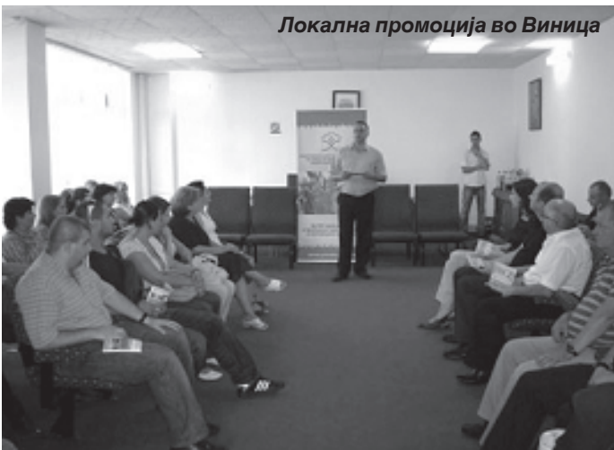
Локална промоција во Винаца

Како финална активност во Програмата, РЦПЛИП – ПОРАКА и Хендикеп Интернационал – Југоисточна Европа на 14-ти Септември 2010 г. во хотел “Холидеј Ин” – Скопје одржаа Национална промоција на Локалните акциони планови за унапредување на положбата на лицата со попреченост во општините Куманово, Охрид и Винаца.