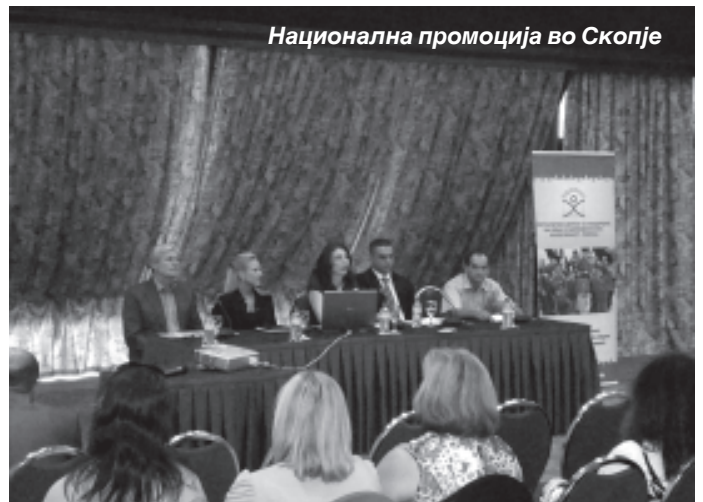
Национална промоција во Скопје